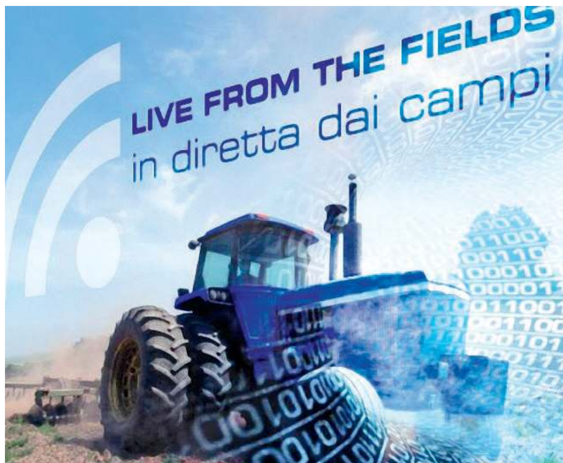
Nei campi. La tecnologia può ridare nuova vita a vecchie macchine